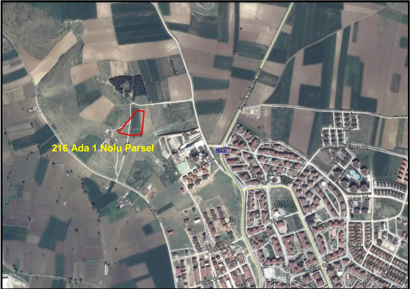
Şekil 1: Plan Değişikliğine Konu Alanın Konumu

Bursa İli, İnegöl İlçesi, Alanyurt Mahallesi, 216 Ada 1 Nolu Parsel; İnegöl-Yenişehir Yolunun yaklaşık 430 metre doğusunda, Atatürk Caddesinin yaklaşık 215 metre kuzeyinde konumlanmıştır.